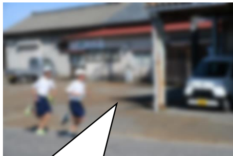
天候も良く、爽やかに走っています！