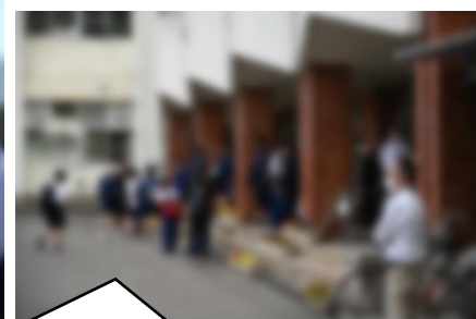
ゴール。皆さんよく頑張りました。