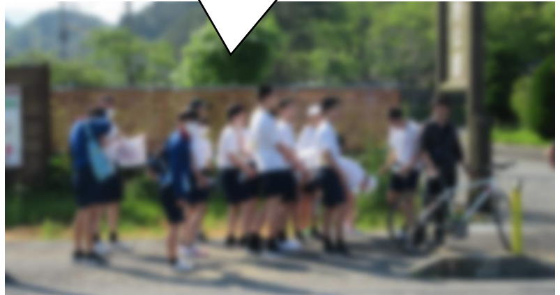
まもなく、五十公野公園の駐車場にて一斉にスタート。