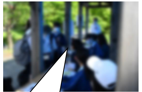
関所でチェック。頑張っています！