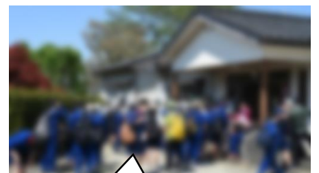
板山関所を通過。次は山内関所を目指して！