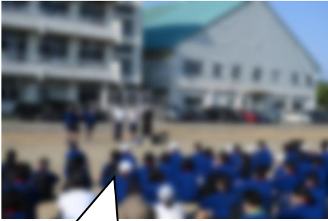
出発式の様子です。全員で五十公野公園に向かいます。

本丸中三大打事の一つ、創立記念行事「第38回参勤交代の道 八里を歩く」を5月7日（土）に実施しました。今年は快晴の中での“八里”となりました。どの生徒も、それぞれの目標を達成するために友達と励まし合いながら歩みを進めていました。当日は道路の安全確保や関所の運営に多くの保護者の皆様、地域の皆様にご協力をいただきました。本当にありがとうございました。また、当校の生徒の活動を温かく見守り声援をいただいた地域の皆様にも感謝申し上げます。