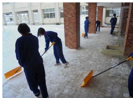
【生徒玄関前の雪かき】

この他、本丸中学校を訪れる多くの方から「あいさつがとてもよいですね。」と、元気なあいさつを褒めていただいています。