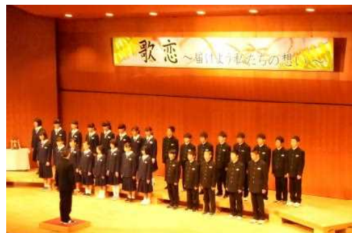
【合唱コンクールの様子】