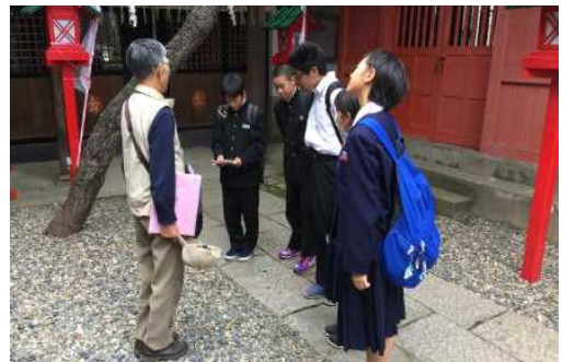
【新潟市班別自主研修】