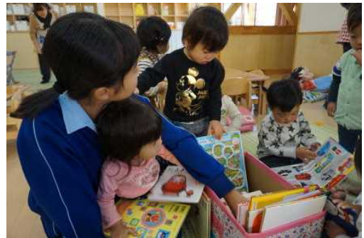
【保育園での職場体験】

このような前向きな本丸中学校区の児童生徒を見ていると、地域全体で子どもたちを健やかに育てている学校区であると強く感じています。