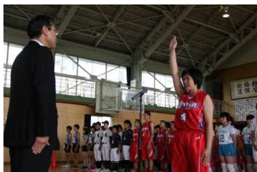
【激励会での選手宣誓】

6月26日(月)には下越地区体育大会の激励会がありました。今年度も全ての部活動が市内大会を勝ち抜き、下越地区大会に出場することになりました。全校生徒が出場選手を応援しながら、選手も互いに応援し、感謝と尊敬の気持ちをもって行った素晴らしい会になりました。全校生徒が様々なことに本気で打ち込む雰囲気があるからこそ、できた結果だと思います。多くの部活動が県大会へ出場することを願っています。