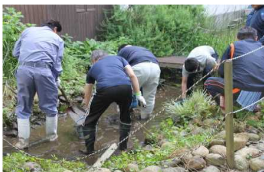
【中庭の環境整備作業】

6月17日(土)のPTA主催中庭整備作業では、朝7時30分から1時間の作業に、生徒約200名、保護者と地域の方々約60名の参加がありました。「中庭や側溝がどんどんきれいになる」と、声を上げてくれた生徒がたくさんいて大変嬉しかったです。参加していただいた方々に感謝を申し上げます。