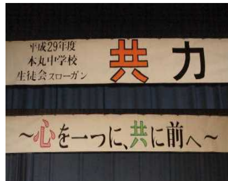
【生徒会スローガン】

このスローガンには「今までと同じことをただこなすだけではなく、一人一人が更に積極的に取り組んでいくこと。『誰かがやってくれる』と人任せにするのではなく、一人一人の力をよりよい本丸中学校を創るために発揮すること。一人の力は小さくとも全校で力を合わせれば大きな一歩に繋がること。」この願いが込められています。来年3月には大きな足跡を残してくれることでしょう。