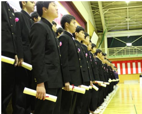
♪卒業合唱♪ 「旅立ちの日に」