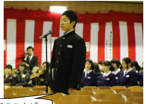
在校生代表のことば