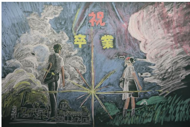
二年生が丁寧に心をこめて製作してくれた黒板アート