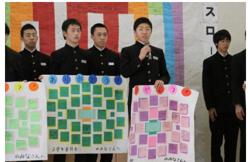
【生徒会引き継ぎ式の様子】

2月は1年間のまとめの月になります。生徒会活動では後期の生徒総会が行われ、1年間の生徒会活動を振り返ると共に、3年生から1・2年生に引き継ぎが行われました。今年は、生徒会本部や各専門委員会で、例年以上に工夫した様々な活動を企画し、生徒全員で学校をより良くしようという意識をもって取り組んできました。そのため、この1年間、生徒会活動はとても活発に行われたと思います。引き継ぎ式では、全校生徒が書いた生徒会本部や各専門委員会への感謝の